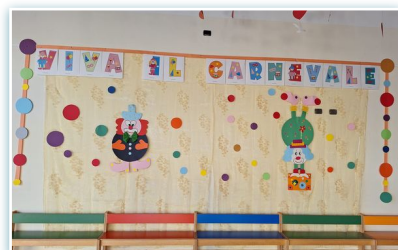
Carnevale nella scuola di Sant'Angelo Lodigiano.

* Il 5 febbraio su Relevant Radio nella sezione "The Merry Beggars" nel contesto del podcast TheSaintsPodcast è uscito un episodio tutto dedicato a Santa Cabrini.