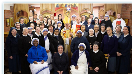
Incontro intercongregazionale delle religiose della diocesi di Novosibirsk.