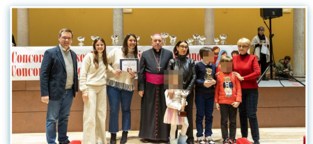
Premiazione per il primo premio del concorso dei presepi.

* Il 10 gennaio i membri di Cabrini Immigrant Services CIS-NYC sono stati al fianco della New York Immigration Coalition (NYIC) e di altre organizzazioni a Washington DC, per riaffermare il loro impegno a sostenere la giustizia e i diritti dei migranti.