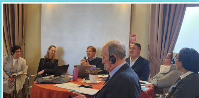
Un gruppo di lavoro durante l'incontro della Commissione Cabrini per la Salute Globale.