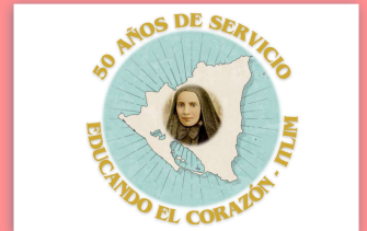
Logo 50° anniversario.

L'Istituto Tecnico La Inmaculada , in Nicaragua, ha festeggiato i 50 anni di servizio educativo. La comunità ha celebrato questo anniversario riflettendo su ciò che abbiamo costruito come memoria, come Chiesa, come Popolo di Dio accompagnato dalla presenza delle MSC, all'insegna del carisma di Santa