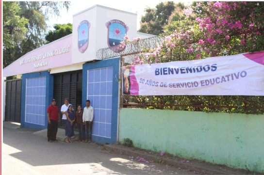
Istituto tecnico La Inmaculada.