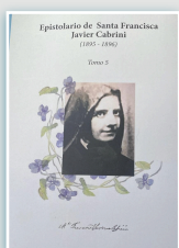
Copertina V tomo.

Abbiamo celebrato in questa giornata uno dei ministeri più importanti per il nostro Istituto. Grazie a chi nel mondo cabriniano dedica la propria vita a questo! Ancora oggi si continua l'apostolato di "educazione del cuore" di Madre Cabrini!