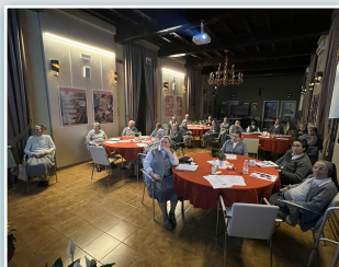
Foto dall'Assemblea Mater Gratiae.

Dal 12 al 16 gennaio si è svolta l'Assemblea Provinciale Mater Gratiae. Durante gli incontri le Suore e i laici hanno elaborato delle linee guida per il prossimo triennio. Le varie missioni hanno avuto poi modo di presentare le proprie opere e attività. In un clima fraterno e di condivisione si è apprezzato molto lo spirito cabriniano e si è accolto con grande fiducia il gruppo di missionarie laiche, gruppo che sta crescendo sempre più nella Provincia.