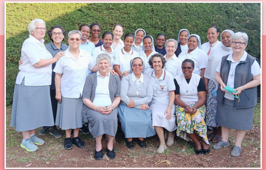
Tutte le Suore MSC presenti ai festeggiamenti in Etiopia.

state le suore arrivate da tutta la Regione e anche da altre parti dell'Istituto per questa occasione. La gioia e la semplicità della celebrazione hanno toccato il cuore di tutti i partecipanti. La celebrazione si è tenuta nella parrocchia di Dubbo, Our Lady of Lourdes , ed è stata presieduta dal vescovo Emiratus Tsegaye Keneni (ex vescovo del vicariato apostolico di Soddo). Al termine della Messa è stata fatta una grande festa con cibo, danze e la tradizionale cerimonia del caffè. L'emittente PAX CTV ha trasmesso l'intera celebrazione eucaristica.