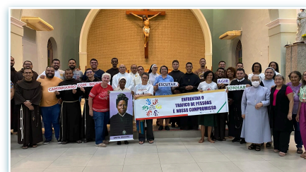
Celebrazione della Giornata Mondiale contro la tratta nel Centro da Juventude in Brasile.

tecnici del CRAS Sul II (Centro per l'assistenza sociale). Il Centro di Gioventù è impegnato con queste attività concrete che proseguiranno anche nel 2024. Sempre nello stesso centro, il 16 febbraio si sono riuniti insieme alla Rete "Um Grito pela Vida" in