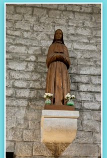
Statua in legno di Madre Cabrini nella basilica Chiesa di Santa Maria del Mar.