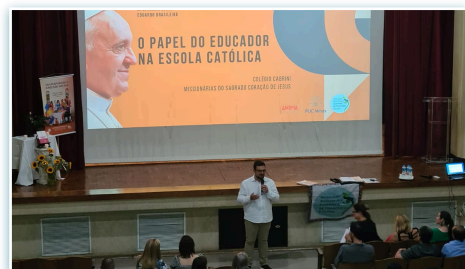
Formazione sul tema della "Campagna di Fraternità 2024" in Brasile.

* Dal 29 gennaio al 2 febbraio in Russia a Novosibirsk come ogni anno