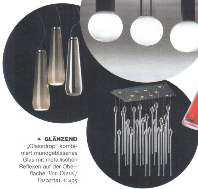
▲ GLÄNZEND „Glassdrop“ kombiniert mundgeblasenes Glas mit metallischen Reflexen auf der Oberfläche. Von Diesel/Foscarini, € 495