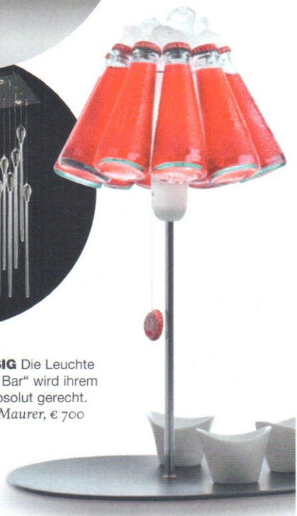
► FLÜSSIG Die Leuchte „Campari Bar“ wird ihrem Namen absolut gerecht. Von Ingo Maurer, € 700