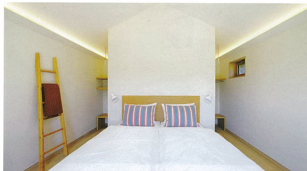
Interior eines Winzerhäuschens.

Weinkulturgut Longen: 20 Winzerhäuschen aus Stein – ein Idyll an der Mosel.