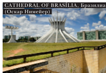
CATHEDRAL OF BRASÍLIA, Бразилиа (Оскар Нимейер)