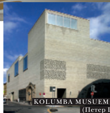
KOLUMBA MUSUEM, Кельн (Петер Цумтор)