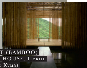
GREAT (BAMBOO) WALL HOUSE, Пекин (Кенго Кума)