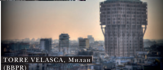
TORRE VELASCA, Милан (BBPR)