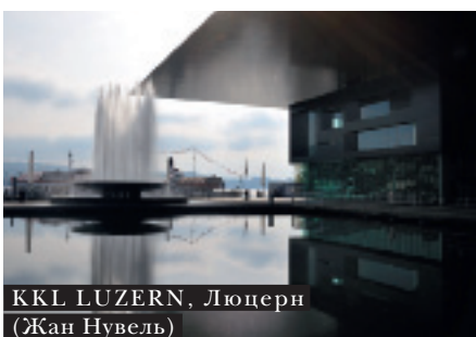
KKL LUZERN, Люцерн (Жан Нувель)

Новую книгу Matteo Thun: The Index Book , вышедшую в издательстве Hatje Cantz, можно использовать как путеводитель: в ней представлены все работы итальянского архитектора – от интерьеров ресторанной сети Variatione до отеля Nhow в Милане. А сам Маттео Тун рассказал о любимых архитектурных шедеврах других авторов