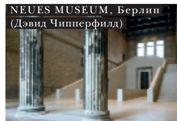
NEUES MUSEUM, Берлин (Дэвид Чипперфилд)