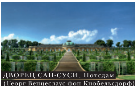
ДВОРЕЦ САН-СУСИ, Потсдам (Георг Венцеслаус фон Кнобельсдорф)