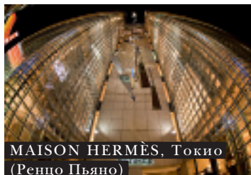
MAISON HERMÈS, Токио (Ренцо Пьяно)