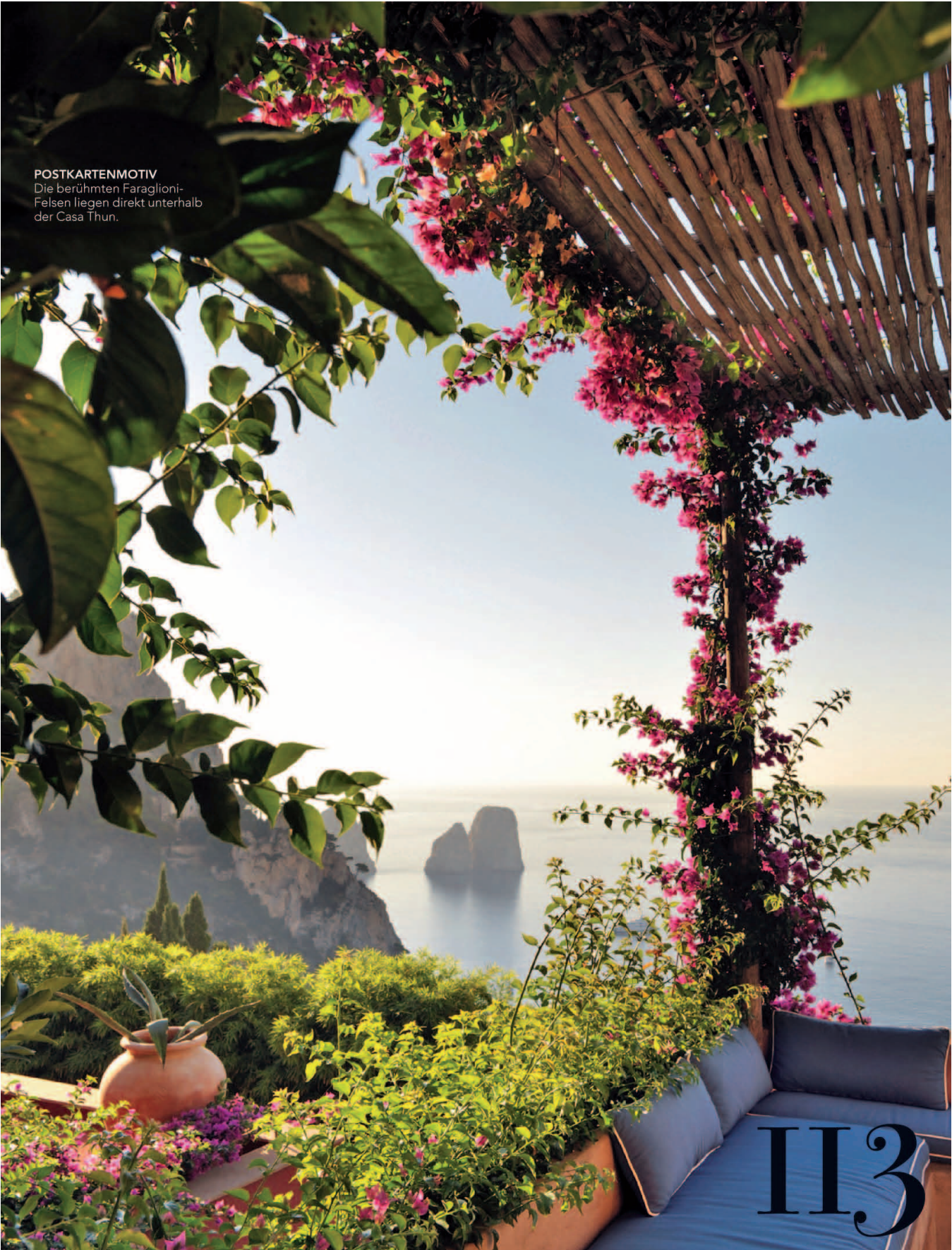
POSTKARTENMOTIV Die berühmten Faraglioni- Felsen liegen direkt unterhalb der Casa Thun.