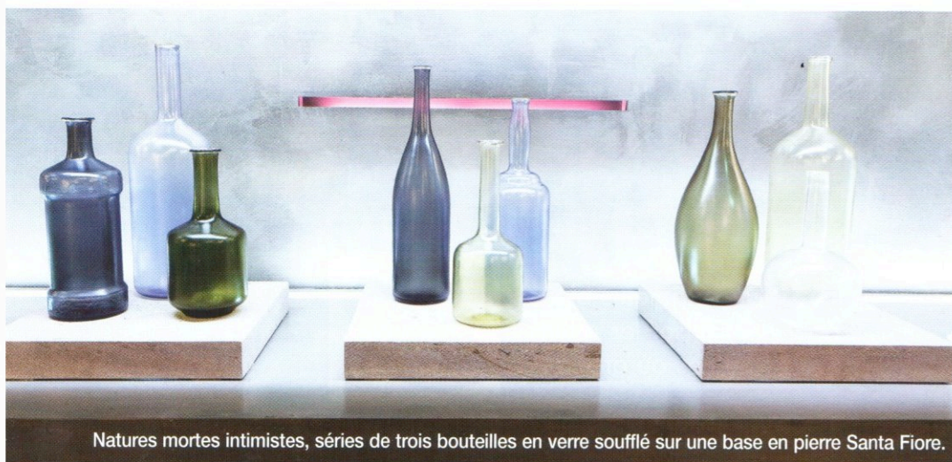
Natures mortes intimistes, séries de trois bouteilles en verre soufflé sur une base en pierre Santa Fiore.