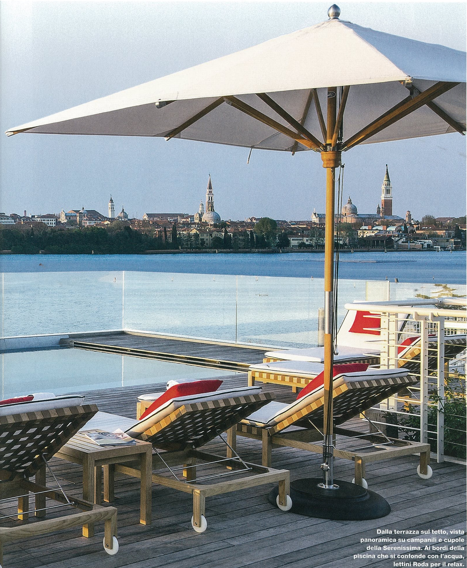
Dalla terrazza sul tetto, vista panoramica su campanili e cupole della Serenissima. Ai bordi della piscina che si confonde con l'acqua, lettini Roda per il relax.