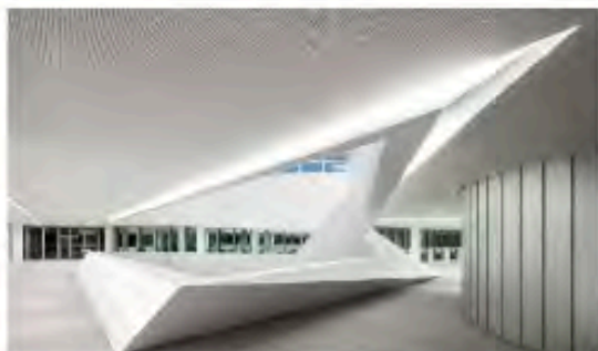
HypoVereinsbank-Tower in München 104