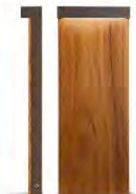
Außenleuchten von SIMES 148