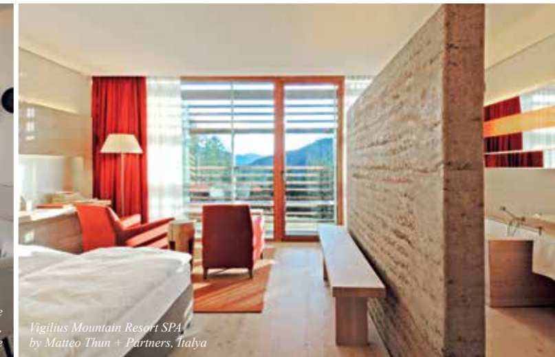
Vigilius Mountain Resort SPA by Matteo Thun + Partners, İtalya