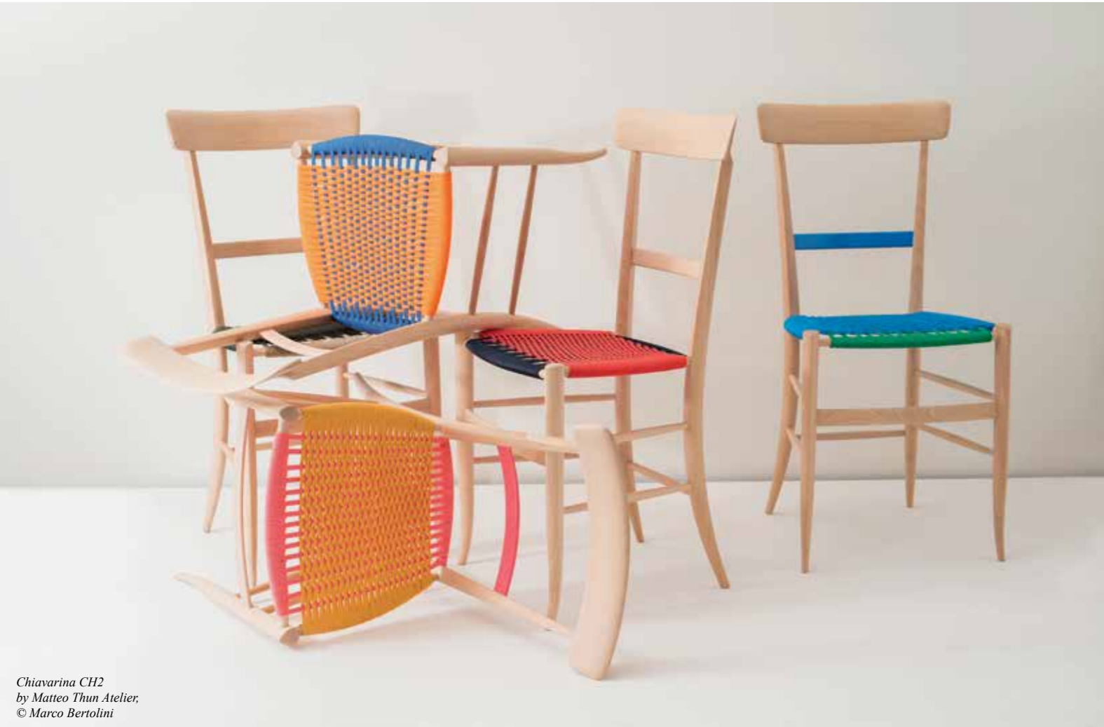
Chiavarina CH2 by Matteo Thun Atelier