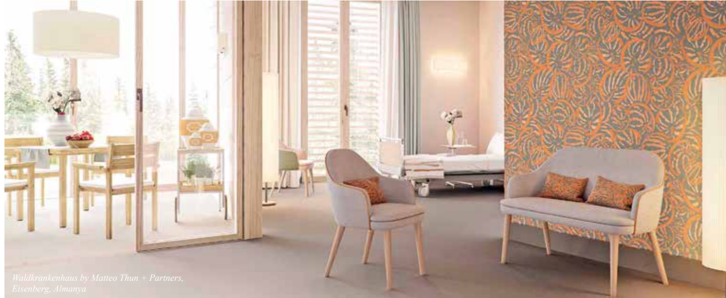
Waldkrankenhaus by Matteo Thun + Partners, Eisenberg, Germany

• Tasarım felsefeniz nedir? Tarzınızı nasıl tanımlarsınız? Sizi diğer tasarımcılardan farklı kılan ne?