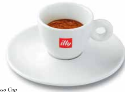
Illy Espresso Cup by Matteo Thun + Antonio Rodriguez

When I opened my studio in the early 80ies I was working, as many architects in Italy, from spoon to city, from micro to macro. Eversince, this has not changed.