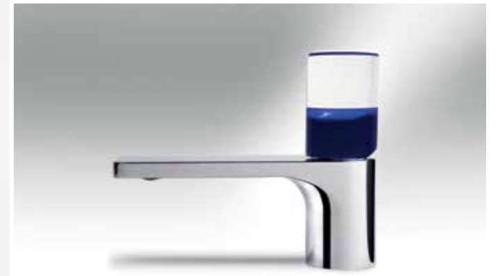
Fantini Faucet Nice by Matteo Thun + Antonio Rodriguez

• Mimari, iç mekân ve ürünler için tasarımlarınız var. İlk bakışta, bunların hepsi birbirinden biraz farklı görünüyor. Endüstriyel tasarım pratiği, iç mekân tasarımı ve mimari uygulama arasında ne gibi bir ilişki var? Birbirlerini nasıl etkiliyorlar?