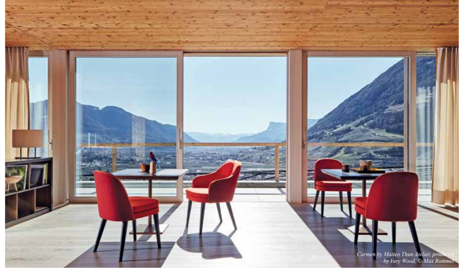
Carmen by Matteo Thun Atelier, produced by Very Wood

We believe in a strong dialogue with our clients and dedicate a lot of time to find solutions within the budgets given.