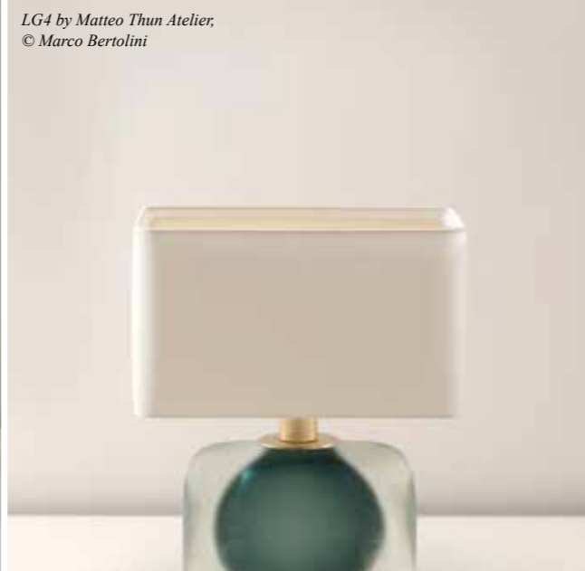
LG4 by Matteo Thun Atelier

• Son zamanlarda üzerinde çalıştığınız projeler ve öne çıkan özellikleri neler?