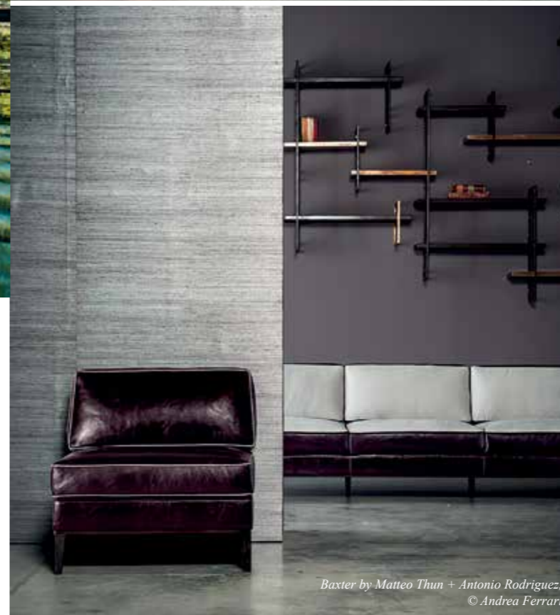
Baxter by Matteo Thun + Antonio Rodriguez