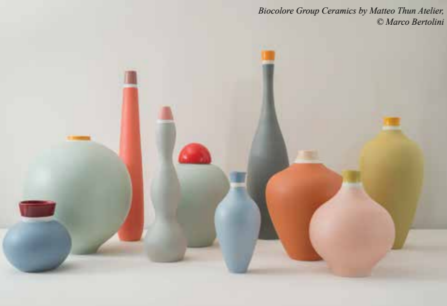
Biocolore Group Ceramics by Matteo Thun Atelier