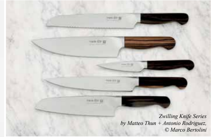
Zwilling Knife Series by Matteo Thun + Antonio Rodriguez