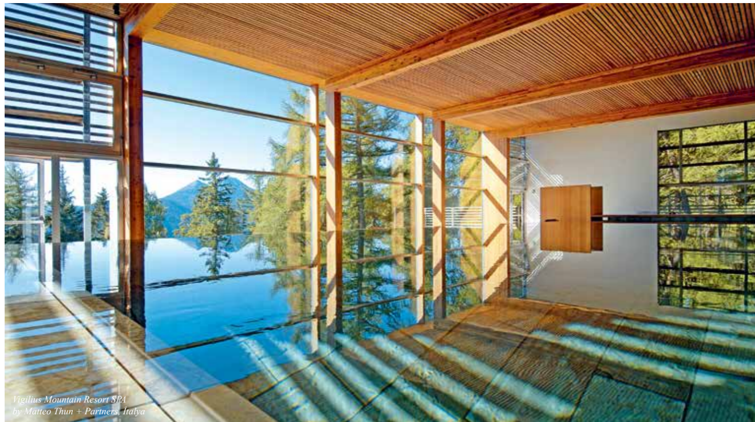
Vigilius Mountain Resort SPA by Matteo Thun + Partners, Italy

• İç mekânın ruhunu yansıtan ve mekânı kullanacak olanların beklentilerini karşılayan, aynı zamanda kendi imzanızı taşıyan bir iç mekân tasarımı yaratmayı nasıl başarıyorsunuz?