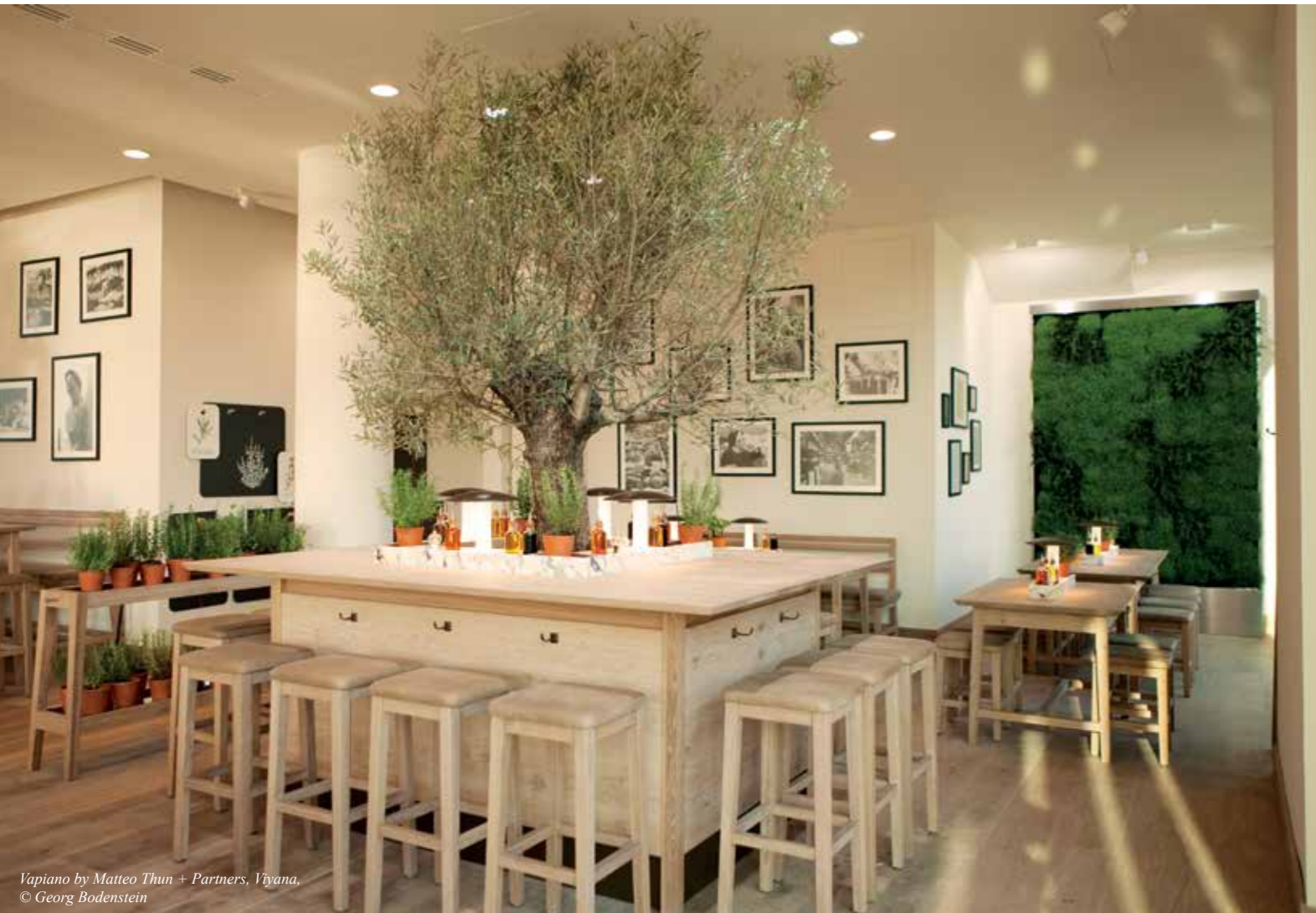
Vapiano by Matteo Thun + Partners, Viyana