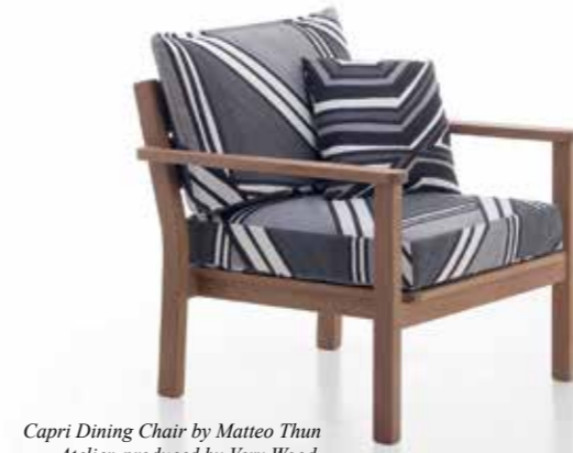
Capri Dining Chair by Matteo Thun Atelier, produced by Very Wood

Demirbaş, mobilya ve ekipmanlar (FF&E) için Matteo Thun Atelier adıyla hizmet sunuyoruz. İkonik mobilya ve aydınlatma koleksiyonları çeşitli renk ve malzeme kombinasyonları ile ilgi çekici hale getirilip kişiselleştirilebiliyor.