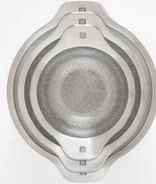
Zwilling Sieve by Matteo Thun + Antonio Rodriguez

When I opened my studio in the early 80ies I was working, as many architects in Italy, from spoon to city, from micro to macro. Eversince, this has not changed.