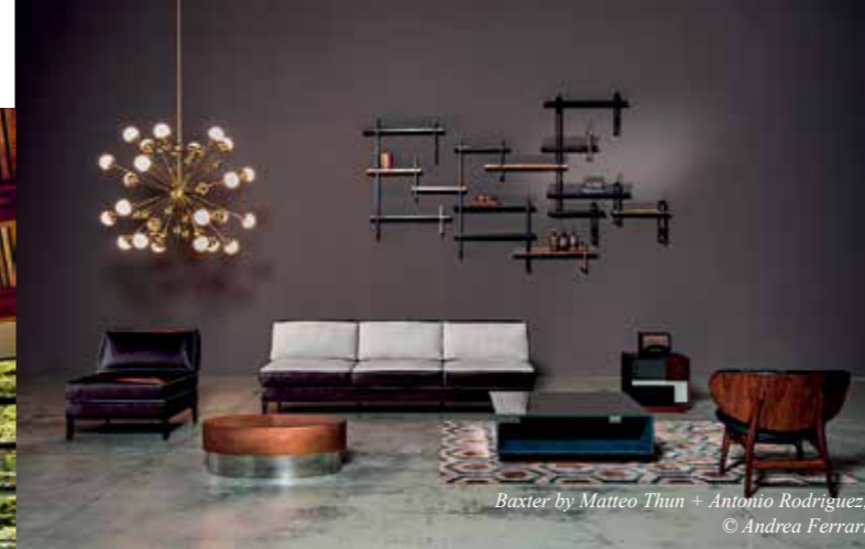
Baxter by Matteo Thun + Antonio Rodriguez

We highly respect the surrounding of the site, the purpose of the building, the people that will live or work inside. The 'genius loci' determines the style of our projects. Is it a 5 star plus hotel, an urban city hotel or a hotel with medical support? We do not intend to be recognizable by a special architecture handwriting but by a sustainable design.