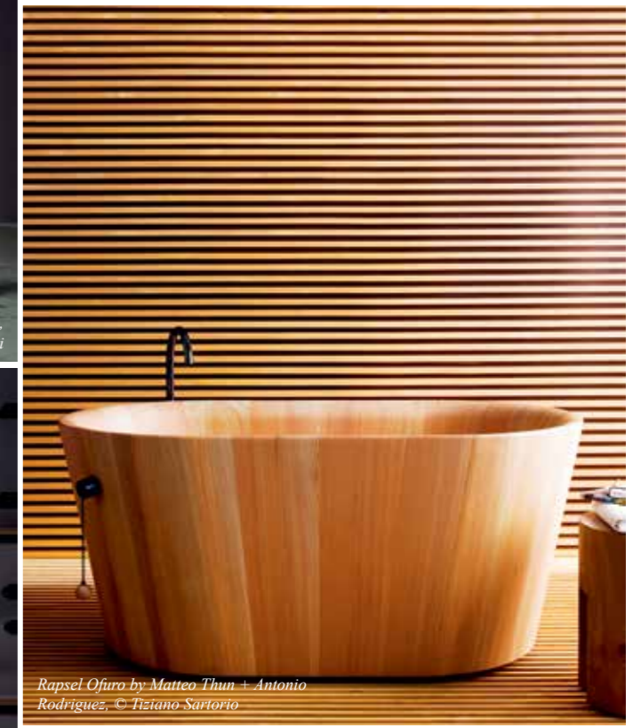
Rapsel Ofuro by Matteo Thun + Antonio Rodriguez