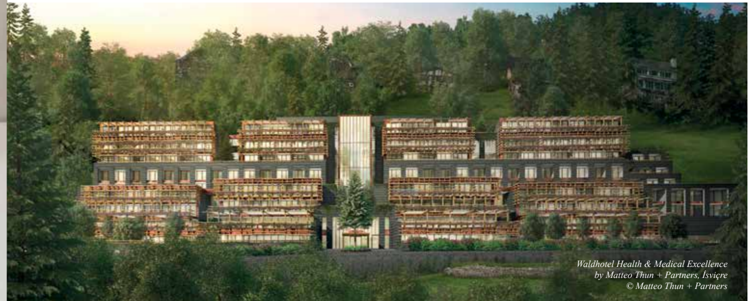
Waldhotel Health & Medical Excellence by Matteo Thun + Partners, İsviçre

We established a service for FF&E: Matteo Thun Atelier. Iconic furniture and lighting collections can be “dressed up” and customised with various combinations of colours and fabrics.