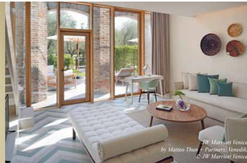
JW Marriott Venice by Matteo Thun + Partners, Venedik