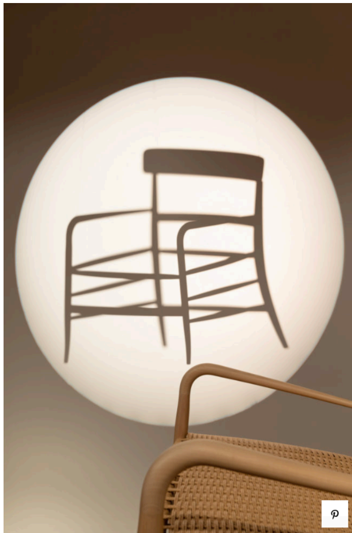
Фото: Marco Bertolini