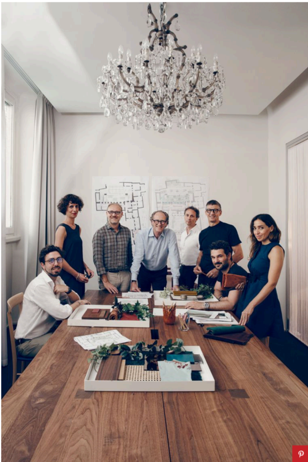
Lo studio Matteo Thun & Partners Mattia Balsamini

'Design Therapy' si presenta come un vero pop-up hotel aperto a tutti dove fermarsi per un aperitivo di nuova ispirazione, per sperimentare un menù innovativo creato per l'occasione da Maio Restaurant, ricevere consigli di fitness e per la cura del sé, informarsi su prodotti e materiali naturali, immersi nella natura.