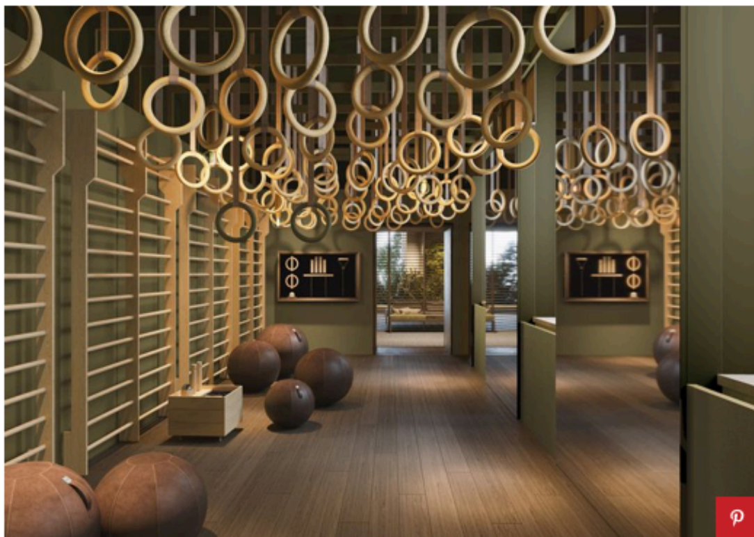
Nella sala Gym, nessuna postazione meccanica: ci si allena con attrezzi ginnici che ricordano le palestre d'antan (anelli, spalliere svedesi, pesi) reinterpretati nel design e nei materiali naturali; ci si esercita con le gym ball in cuoio morbido. Render © Matteo Thun & Partners

Costruito 15 anni fa, segna l'esordio di un hotel che pone al centro dell'attenzione la natura e l'approccio olistico all'ospitalità. Il focus è l'architettura e i rituali che vengono consumati al suo interno. Nel 2012 inizia il progetto del Waldhotel, definito Health and Medical Excellence e aperto nel 2018: "Un vero category maker, risultato della simbiosi tra healthcare e turismo. Il benessere ha infatti definito una nuova forma di hotel, un concept di cui le strutture future dovranno tener conto. 'Design Therapy' vuole documentare il processo in atto", ricorda Matteo Thun. "L'idea è di unire natura e naturalezza, freschezza e stimolazione dei sensi, aspetti nutrizionali e artigianato locale e regionale. Tutti elementi che concorrono a un benessere fisico, mentale e si traducono in un progetto di interior design improntato a una grande semplicità". Perché, come afferma Thun "l'icona che noi abbiamo nel subconscio è fatta di semplicità". Se nella Lounge, una Galleria d'Oro realizzata con graminacee dorate accoglie gli ospiti, nel ristorante Déjeuner sur l'herbe si pranza su lunghe tavolate, tra nicchie a boschetto e l'effetto pergola delle piante, mentre il giardino interno è trasformato in un Hortus sospeso con grandi sfere di ortaggi.