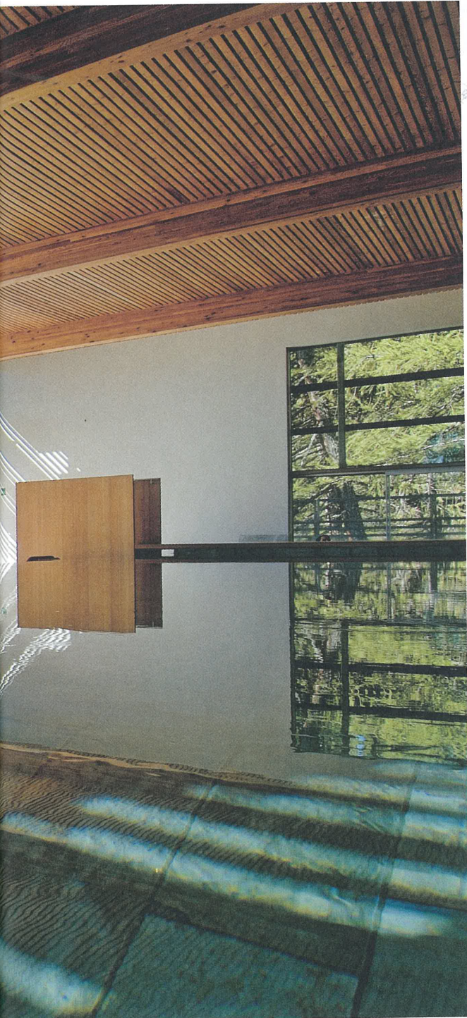
2003 Vigilius Mountain Resort, Lana (BZ) (Matteo Thun & Partners)