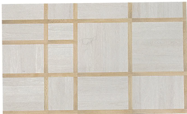
2018 Avenue LISTONE GIORDANO