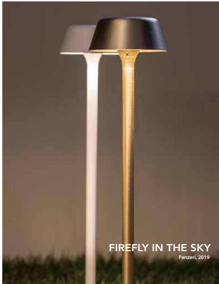
FIREFLY IN THE SKY Panzeri, 2019