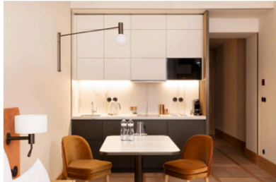
Geeignet für kurze Trips wie für längere Aufenthalte umfassen die Apartments offene Küchen und einen Wohn- und Schlafbereich. The Julius