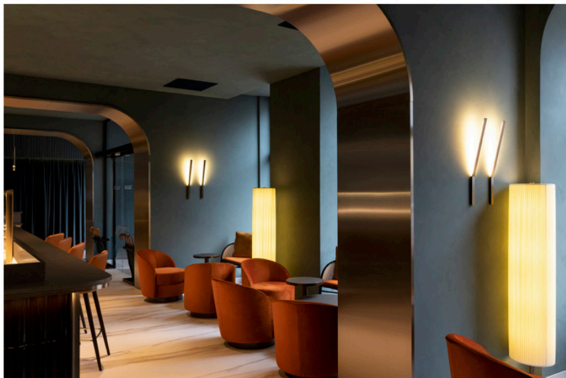
Hat jemand Cocktail gesagt? Vom Frühstück bis zum Abendessen bietet das „Julius“ für jede Zeit des Tages den richtigen Platz. The Julius

Wer schon einmal in Österreich war, dem sollte spätestens im Supermarkt in der Kaffeeabteilung die ikonische rote Zipfelmützenfigur der Marke „Julius Meinl“ unter die Augen gekommen sein. Der Wiener Hersteller vertreibt seit über 155 Jahren Kaffee und Tee und steht mittlerweile stellvertretend für die Wiener Kaffeehauskultur.