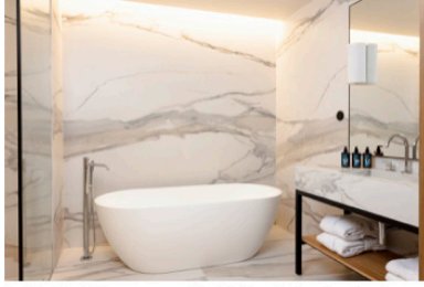
Auf die Details kommt es an: Handtücher, Bademäntel und natürliche Pflegeprodukte stehen bei Ankunft in den Bädern bereit. The Julius